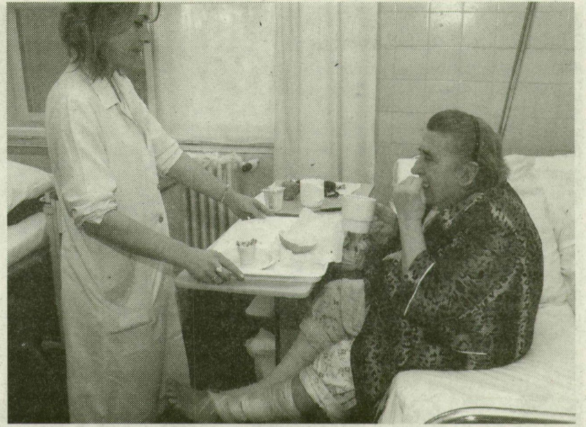
■ EZ A VÁSÁRHELYI BETEG MÁR NEM FIZET NAPIDÍJAT

Vásárhely aktivitásának és a szavazás végeredményének, amely a többség gondolkodásmódját tükrözi - mondta a főigazgató. - Ezt az akaratot tiszteletben tartva hoztam meg döntésemet. Egyébként a vizitdíj és a kórházi napidíj nem jelent számottevő bevételkiesést intézményünknek: 2,4 milliárdos költségvetésünk talán egy-másfél százalékát teszi ki.