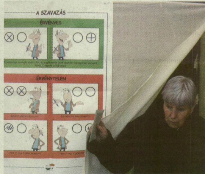
SAVAVAZÁS UTÁN. HOGYAN TOVÁBB?