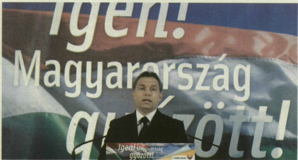
ORBÁN VIKTOR: ÉN VÉGIG REMÉNYKEDTEM AZ IGENEK GYŐZELMÉBEN, DE HOGY, EKKORA SIKER LESZ A NÉPSZAVAZÁS, AZT CSAK TITOKBAN REMÉLTÉM

A Szabolcs-Szatmár-Bereg megyei Nagyarsányban a szavazókör kinyitása előtt rosszul lett és meghalt a szavazatszámoló bizottság egyik tagja. A Győr közeli Nyúl községben egy 72 éves asszony halt meg, miután a szavazókörből kilépve rosszul lett és összeesett, a Borsod megyei Tornanádaskán pedig a szavazóhelyiségben lett rosszul és halt meg egy 74 éves férfi. Rosszul lett egy szavazó Budapesten, a XVII. kerület egyik szavazókörében. Újraélesztették, majd kórházba szállították.