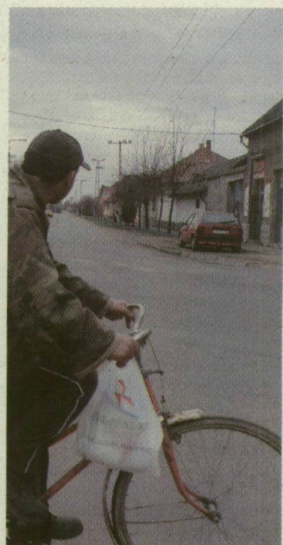
■ A MAKÓI ORSZÁGÚT ELEJE A VÁSÁRHELYI ÚJJVÁROSON. ITT ÉLT SZÁZ ÉVE A MAJOMLÁNY

→ ÖRDÖGFÍÓKÁK. A középkorban a torzszülötteket a sátán gyermekeinek hitték, és ördögfíókáknak nevezték őket. Kegyetlenül üldöztek az ilyen, általában szellemileg is visszamaradott embereket, akiket legtöbbször anyjukkal együtt elpusztítottak.