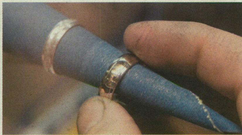
■ Mind arany és fénylik: felületcsiszolás és polírozás

→ DUPLA ÁR. Az arany világgiazi ára az utóbbi két évben duplájára emelkedett: 550-560 dollár volt egy uncia arany és most 1000 dollár körül van az alapanyag ára. (1 uncia = 31,103 g) Az arany tiszta állapotban igen nyújtható, lágy fém, akár 0,0001 mm vékony fólia is készíthető belőle (aranyfűst). Az ékszerészet, kis kopásállósága miatt, különböző fémekkel készített ötvözeteket használja. Ezüst vagy réz hozzáadásával, 18 K (75% arany) és 14 K (58,5% arany) ötvözeteket készítenek, ezek szilárdabbak és kopásállóbbak. Az arany palládiummal készített ötvözet a könnyű fehérarany, a platínával alkotott ötvözet pedig a nehéz fehérarany.