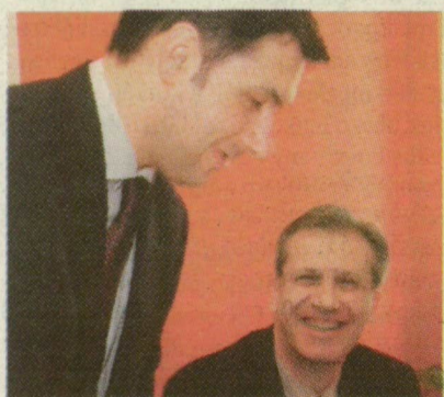
■ LÁZÁR JÁNOS ÉS MAGYAR BÁLINT EGYÜTT TARTOTT SAJTÓTÁJÉKOZTATÓT