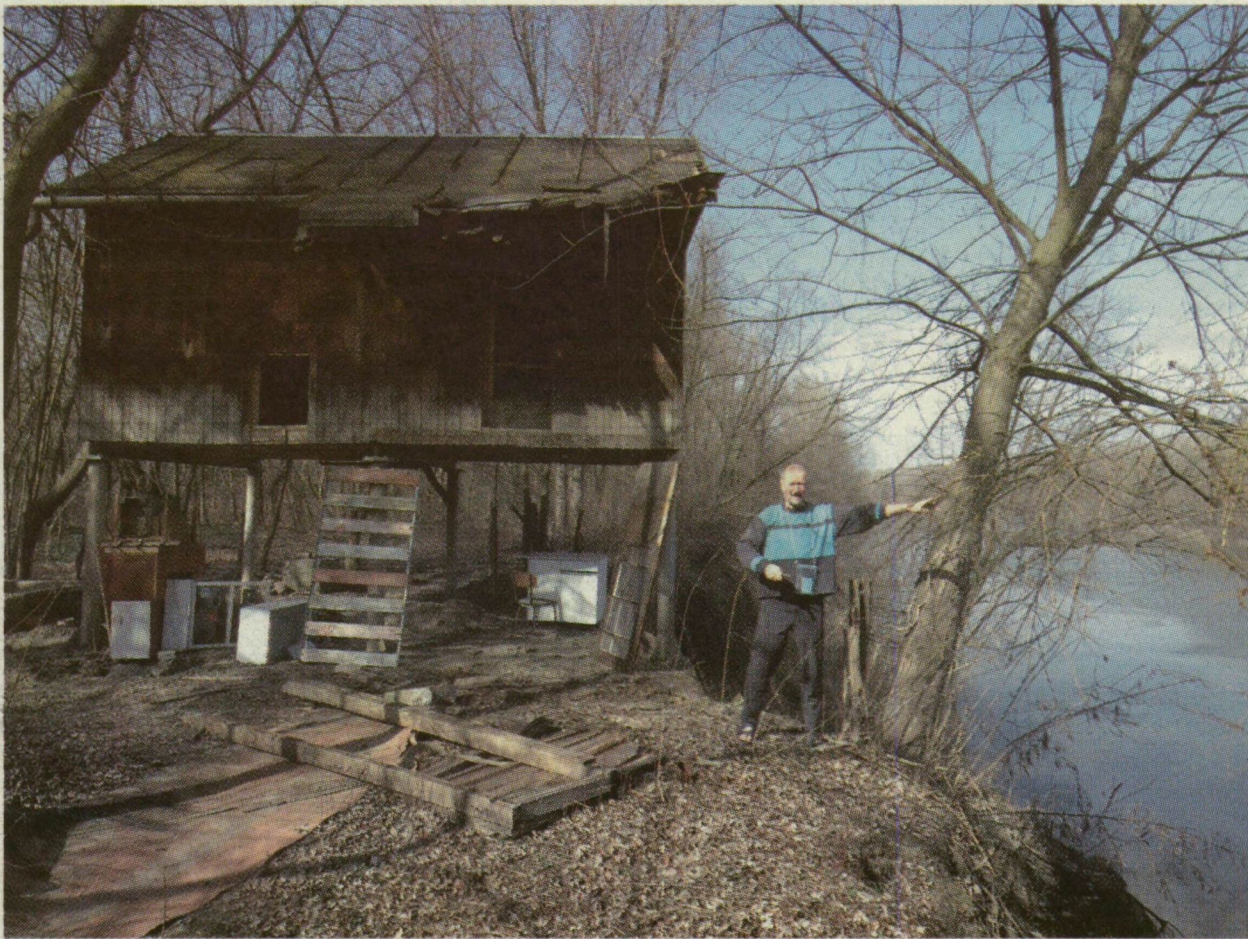
A SZEGEDI MAROS-PART EGYIK LEGSZEBB RÉSZÉN EHHEZ HASONLÓ DÜLEDEZŐ VISKÓK „ÁLLNAK”