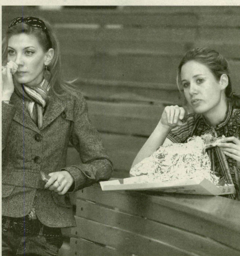
■ A NAGY IZGALMAK KÖZEPETTE EGYES HALLGATÓK MEGÉHEZTEK

Korábban megírtuk: az egyetem több diákja az oktatási jogok biztosához fordult, mert jogszerűtlennek és antidemokratikusnak tartják a hallgatói önkormányzat működését.