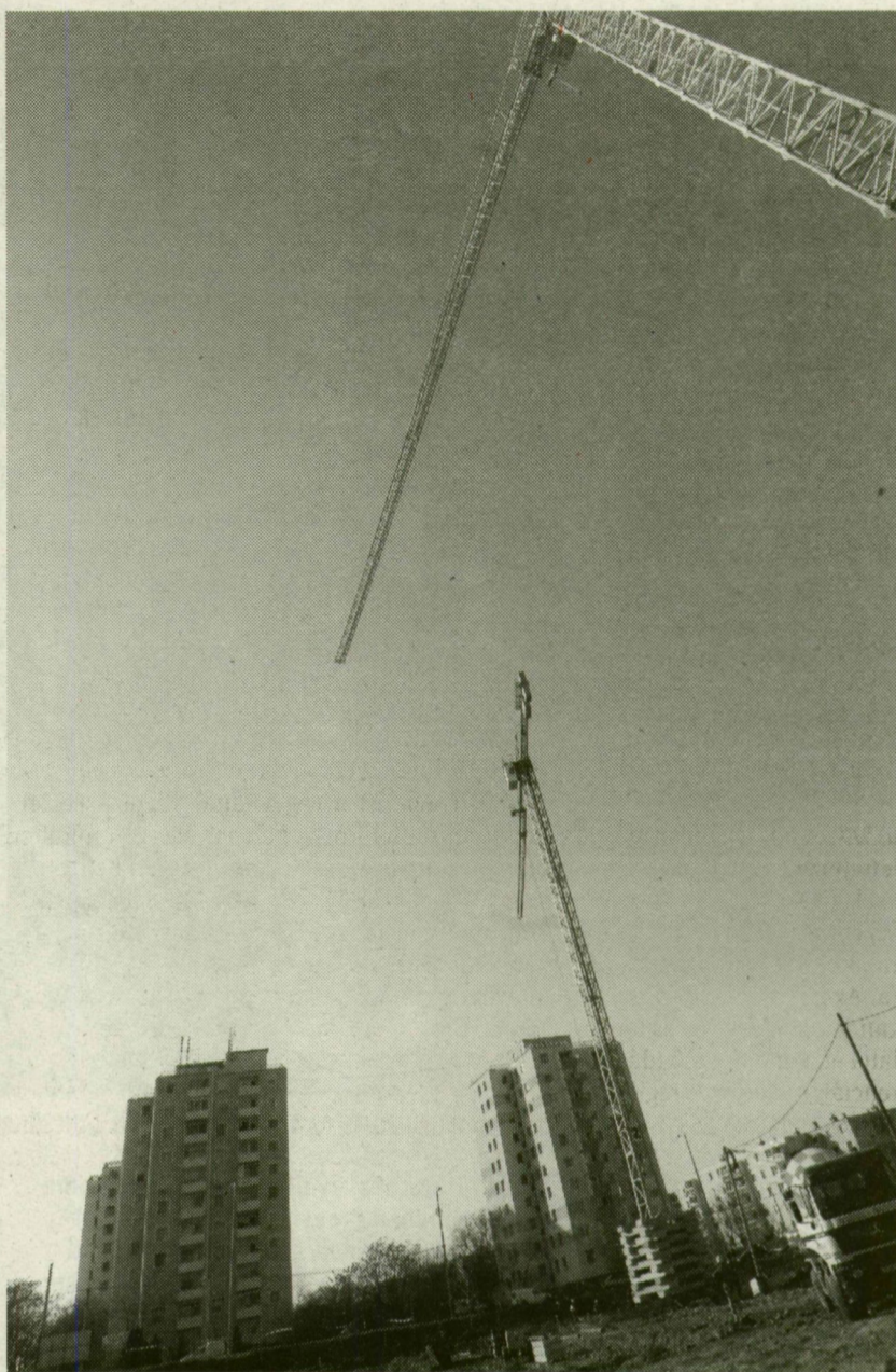
■ HATALMAS KARCSÚ GÉMEK FORGOLÓDNAK. HAT TONNÁT IS ELBÍRNAK

Először a lenti, piros sisakok lesznek egészen apró pontok, aztán már