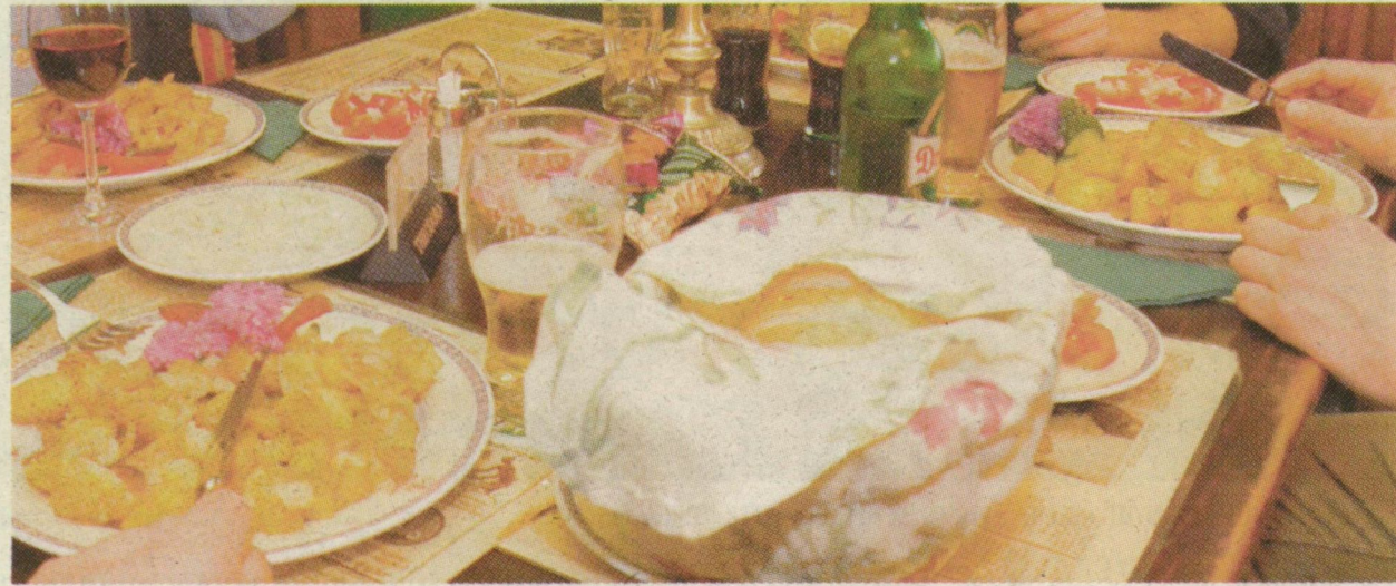
TERÍTETT ASZTAL. AZ ÉTEL MINŐSÉGÉÉRT A VENDÉGLÁTÓS FELEL