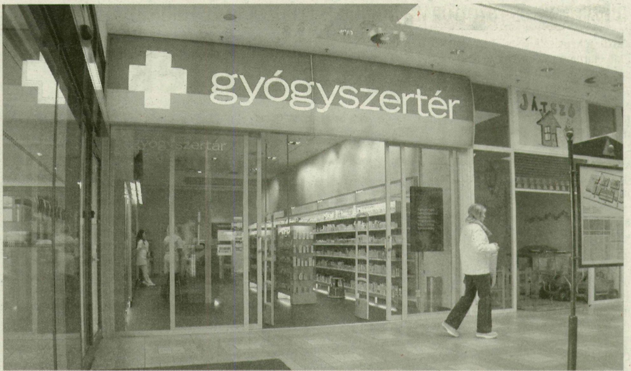
MÁRCIUS 3-ÁTÓL A SZEGED PLÁZÁBAN MŰKÖDŐ GYÓGYSZERTÉR PATIKA LÁTHATJA EL AZ ÜGYELETET