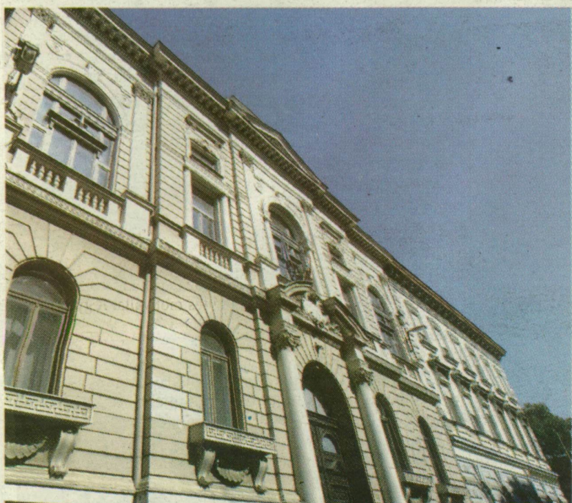
A MŰVELŐDÉSI HÁZAT AZ ÜGYÉSZSÉG IS SZERETNÉ MEGKAPNI