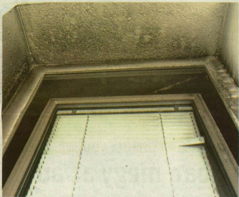
KORMOS KONYHAABLAK A TRAGÉDIA HELYSZÍNÉN