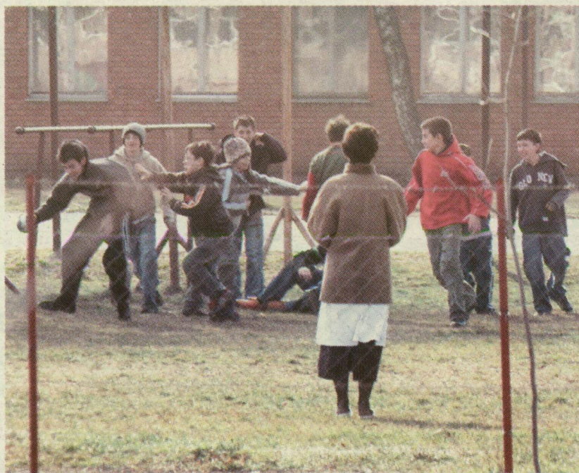
■ A TISZASZIGETI ISKOLA UDVARÁN TEGNAP IS JÁTSZOTTAK LÖKDÖSÖDÖSET A DIÁKOK

Megzúzódt az állkapcsa egy ötödikes kislánynak a tiszaszigeti iskolában. Becsöngetés után nyolcadikos fiúk fogták közre, csiklandozni kezdték, mire a lány a földre esett. Az édesanya szerint az ilyen esetek mindennaposak az iskolában, az igazgató azt mondja, a gyerekeknél életkori sajátosság a veszekedés.