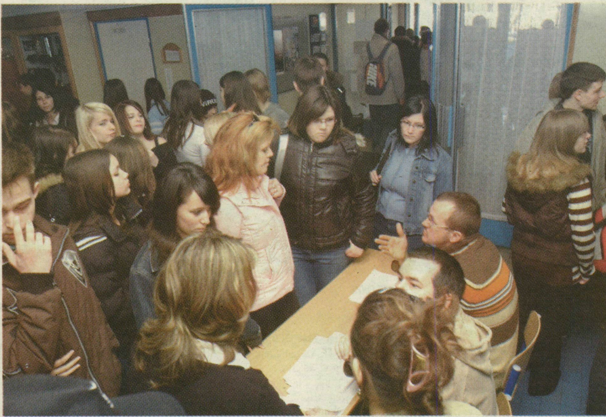
■ A SZEGEDI KRÚDY SZAKKÖZÉPISKOLÁBAN TEGNAP HÁROMSZÁZ NYOLCADIKOS FELVÉTELIZETT

A tavalyinál kevesebb, összesen 350 nyolcadikos jelentkezési lapja érkezett