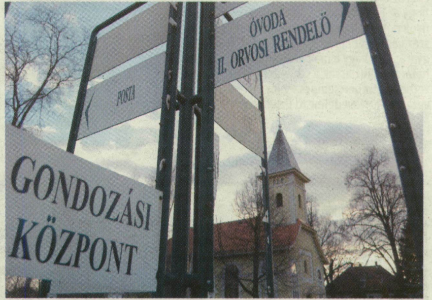
ÚTBAIGAZÍTÓ TÁBLÁK A FŐTÉREN

A közel háromezer lelkes faluba legutóbb fiatal csonka családok költöztek ki a könnyebb megélhetés reményében, de be kellett látniuk: falun élni sem fenékgig tejfel. Amúgy túlnyomóan nyugdíjaskorúak lakják a községet, minden második ember a környékbeli tanyákon él. A falu önhibáján kívül hátrányos helyzetű, ennek ellenére nem kap támogatást, mivel tavaly szigorodtak a feltételek. Emiatt