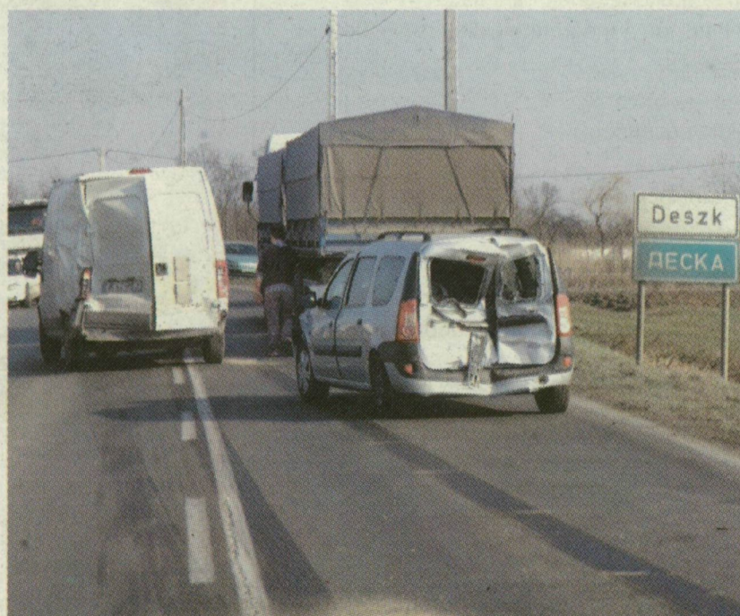
■ A SZABÁLYOSAN KÖZLEKEDŐ AUTÓKAT KAMIONOK TOLTÁK MEG