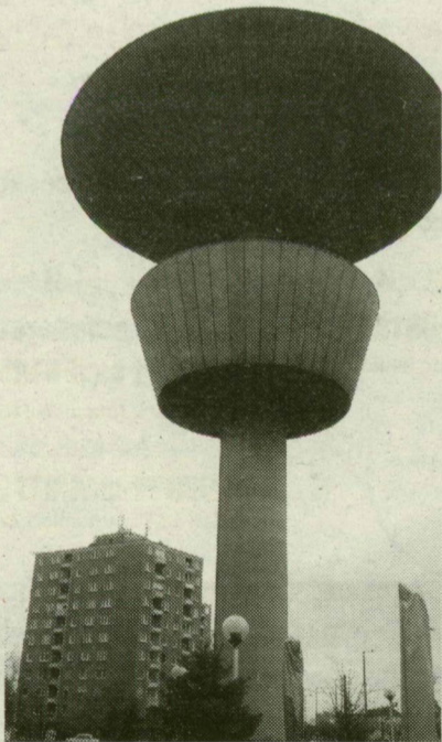
■ A RÓKUSI VÍZTORONY A LEGIFJABB SZEGEDEN – MAGASSÁGA ÉS KAPACITÁSA ALAPJÁN IS LISTAVEZETŐ

víztornyokat kellett építeni a városban: a Délép jóvoltából először a tarjáni, majd a Töltés utcai készült el. Mégpedig nem állványozással: egy belül álló daru emelte egyre feljebb a növekvő torony építőanyagát.