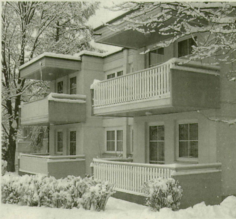
■ ITT LAKNAK A BALESETET SZENVEDETT DIÁKOK