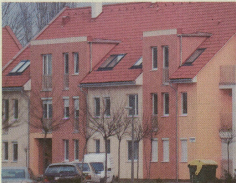
■ A lakóparki lakásokat sokan veszik részletre