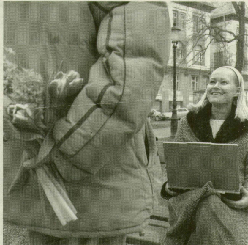
■ Elindíthatja, vagy színt visz a kapcsolatba az on-line flörtölés

Ismerkedni akárhol lehet: autóbúson, diszkóban, munkahelyen. De sokan érzik úgy, nincs egy hely, ahol párkapcsolatot lehetne kialakítani. A könnyen barátkozóknak és a kapcsolatépítésben ügyetleneknek is segíthet az internet. Mert a számítógépes világhálón is szerelembe eshet egy férfi és egy nő, mindegy, hogy tini vagy nagyí.