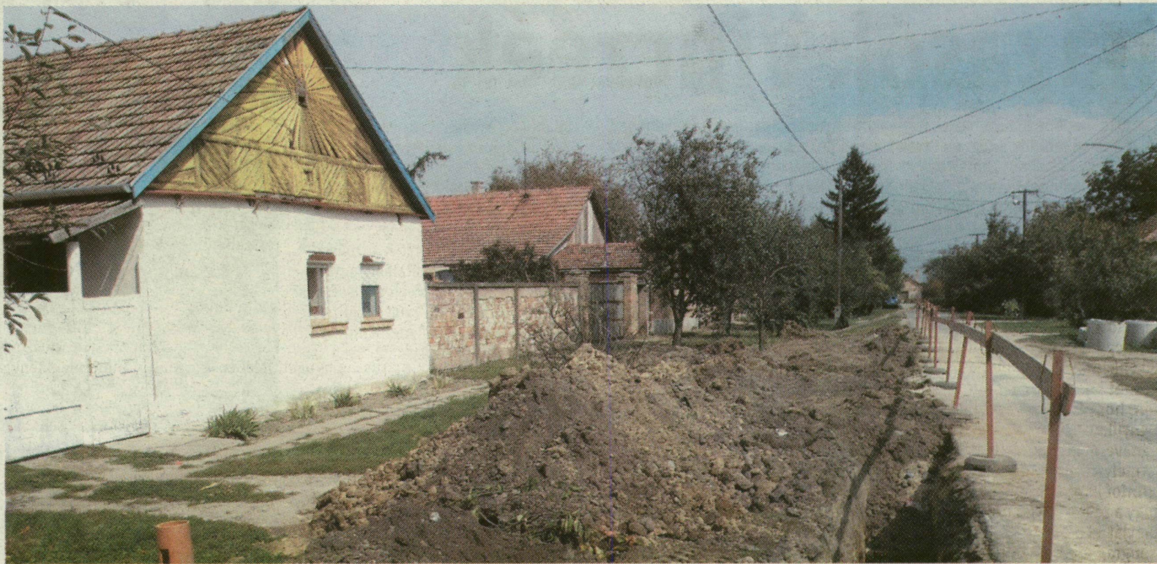
TÖBB ÉVEN ÁT ÉPÜLT A GYORSAN FEJLŐDŐ DESZK CSATORNAHÁLÓZATA