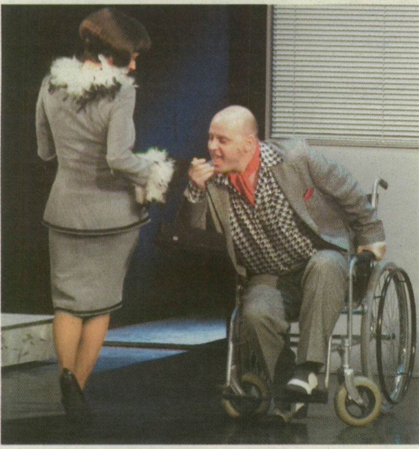
SZOMBAT ESTE JANIKNAK VASTAPS JÁRT ERŐFESZÍTÉSÉIÉRT

ÚJJÁVARÁZSOLJÁK A RÉGIT. Egy speciális technika segítségével a régi fekete-fehér képekből színes fotók készíthetők, így olyan, mintha a dédszülok tegnap ültek volna a műteremben. Papírképet egyébként 47-749 forintért hívhatunk elő darabonként. A végösszeg függ a megrendelt fotó méretétől, és attól, hány képet akarunk.