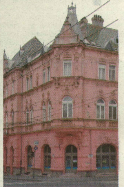
SZÍNES CSEREPEIVEL SZÁZHUSZONÖT ÉVE DERŰS SZÍNFOLTJA SZEGEDNEK A MILKÓ-PALOTA