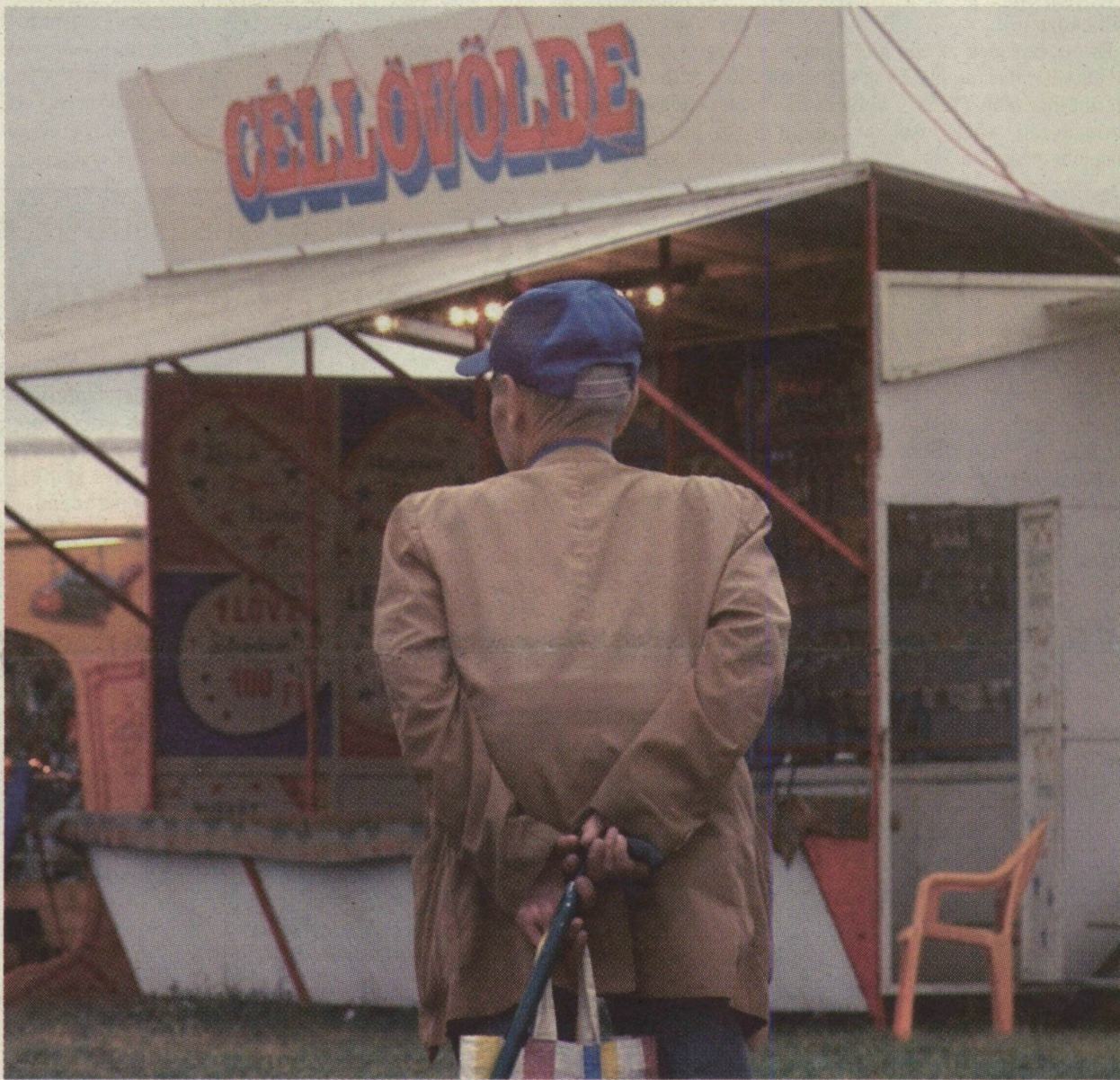
■ AZ ÖREGKORRA FEL KELL KÉSZÜLNI, HOGY NE NYOMORKÉNT, HANEM ARANYKORKÉNT ÉLHESSÜK MEG