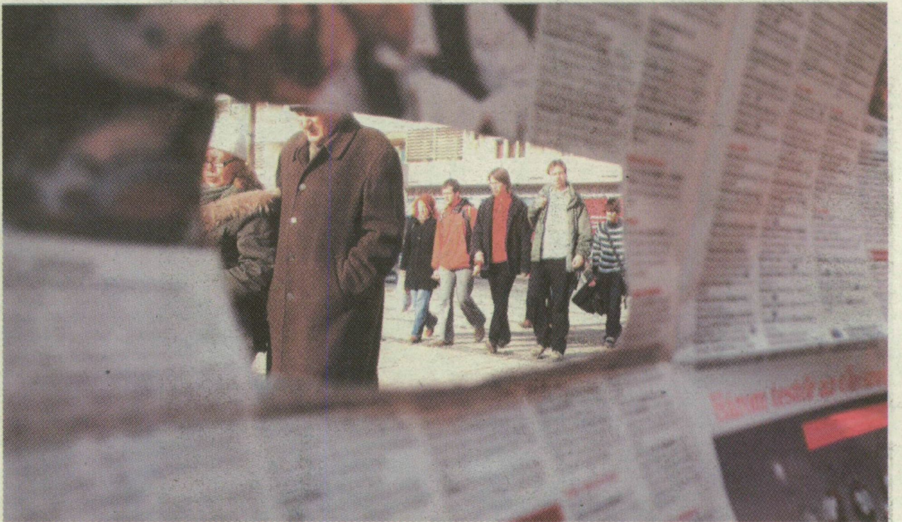
A MAGÁNNYOMOZÓK CSAK A SZERELMI FÉSZEK BEJÁRATÁIG FIGYELIK MEG A HÁZASSÁGTÖRÖKET