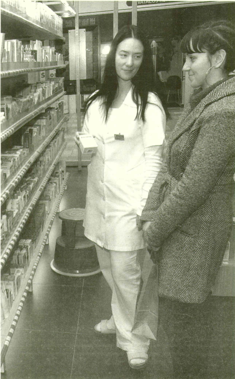
■ A PLÁZAPATIKA VÁLLALNÁ A PLUSZTERHEKET