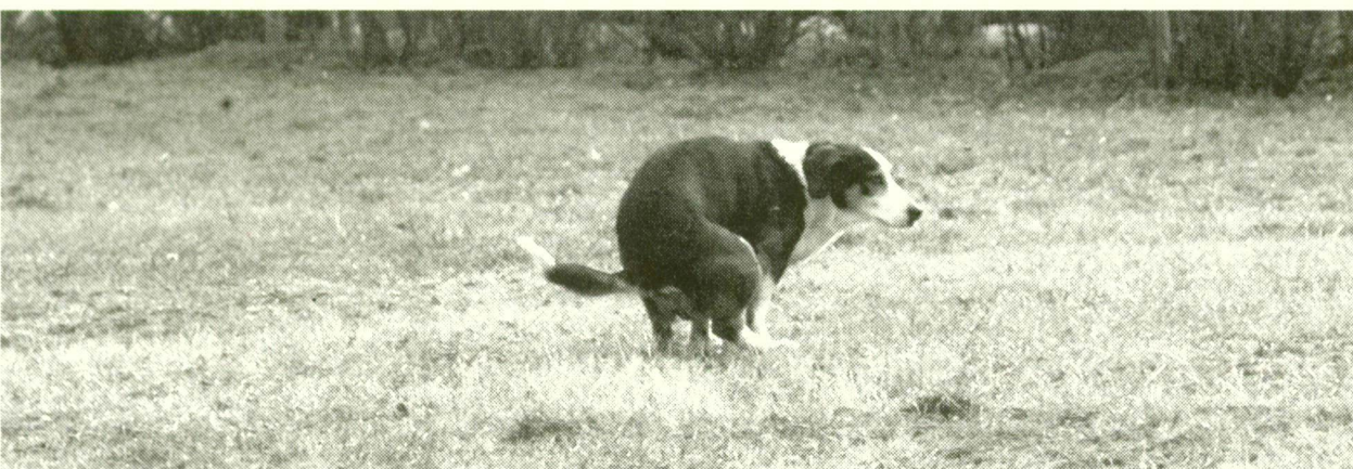
■ KUTYA ÜL A FÜBEN – SAJNOS A GAZDIK TÖBBSÉGE IS LAPÍT AZ ILYEN SZITUÁCIÓKBAN

Tegnap lapszámkban a 14 év alattiak által elkövetett bűncselekményekről közöltünk megyei összeállítást. A címlapon a szegedi Arany János Általános Iskola előtt készült felvételt használtuk illusztrációként. Az intézménynek semmi köze a témához, ott nem történt semmiféle atrocitás a gyerekek között. Az esetleges kellemetlenség miatt az érintettektől elnézést kérünk.