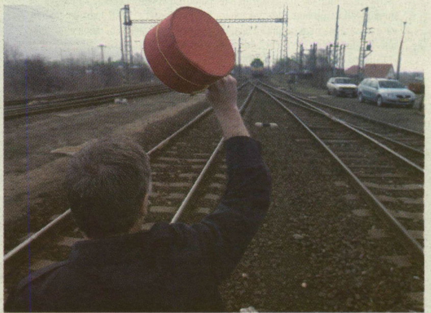
■ EZ A VONAT ELMENT