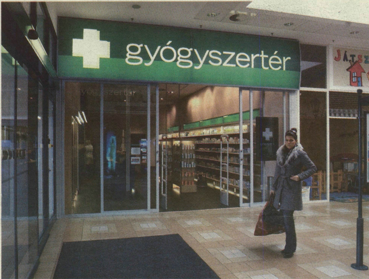
■ NEMCSAK MOZIBA, HANEM ÜGYELETBE IS A PLÁZÁBA JÁRHATUNK