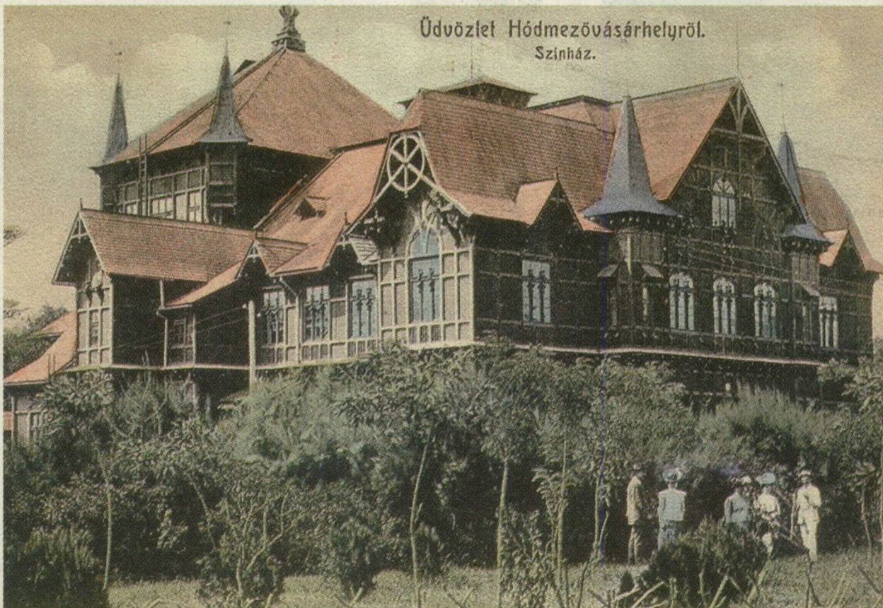
A NYÁRI SZÍNKÖR MEGHATÁROZÓ ÉPÜLETE VOLT VÁSÁRHELYNEK