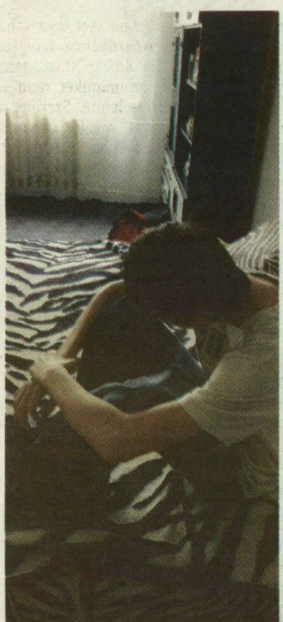
■ ZSOLTIT NEM ELŐSZÖR TÁMADTÁK MEG AZ UTCÁN

lyel az ellenzéki párt a kádári ingyenesség hamis illúzióját kelti. A vizitdíj fontos, mert megalapozza a korrekt megrendelő-szolgáltató viszonyt a rendelőkben. Szerinte a kórházi napidíj az ellátással való pontos elszámolás miatt szükséges, a felsőoktatási tandíj pedig ugyancsak minőségi megrendelő-szolgáltató viszonyt eredményez.