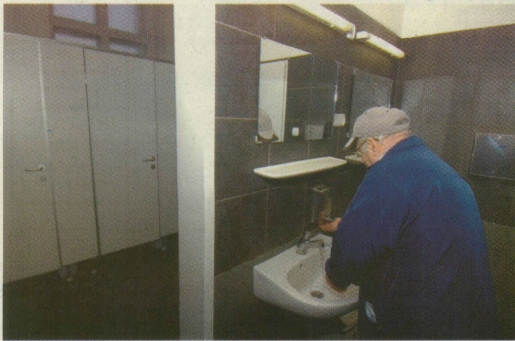
A NAGYÁLLOMÁS TOALETTE IS ELISMERÉST KAPOTT