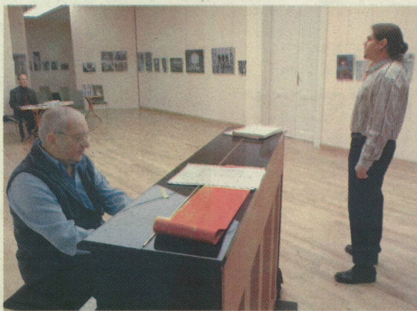
A MAGYARORSZÁGI ELŐDÖNTŐT TAVALY NOVEMBERBEN RENDEZTÉK A REÖK-PALOTÁBAN