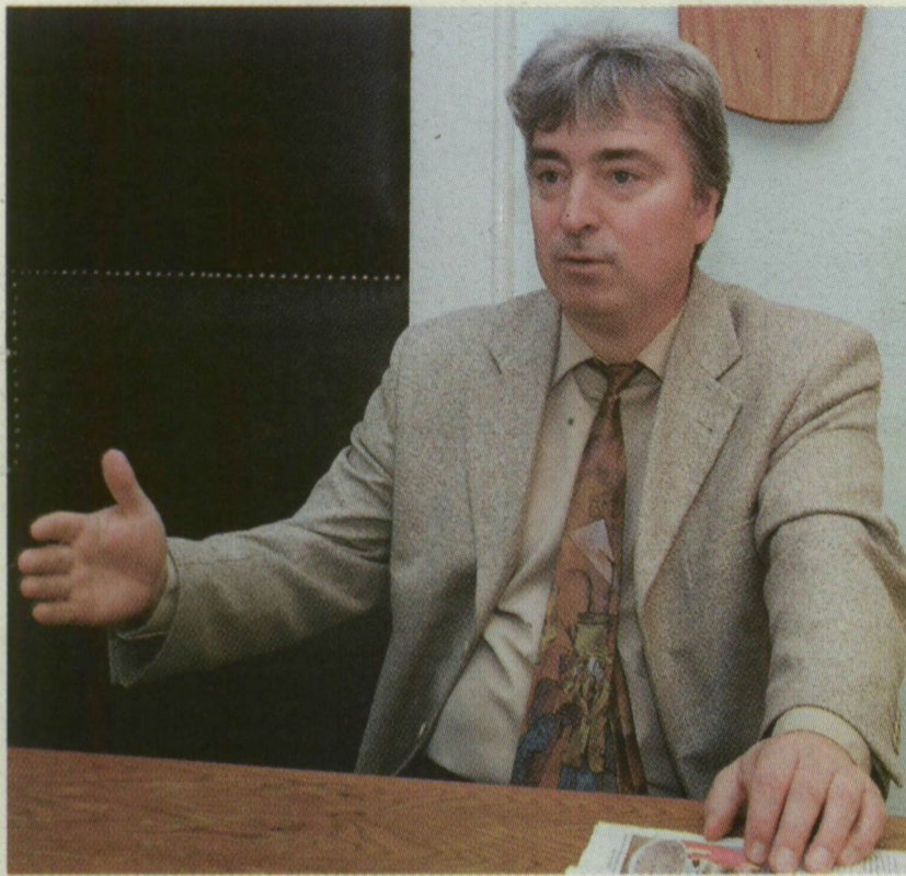
■ A POLGÁRMESTER ÜGY LÁTJA, VELE EGYÜTT AZ EGÉSZ TESTÜLETNEK LE KELLENE MONDANIA