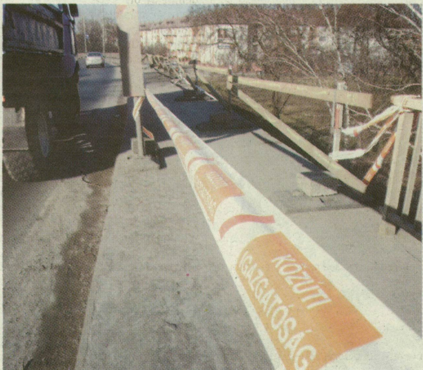
A BICIKLISEKNEK ÉS A GYALOGOSOKNAK EL KELL KERÜLNIÜK A JANUÁR 7-1 BALESET HELYSZÍNÉT