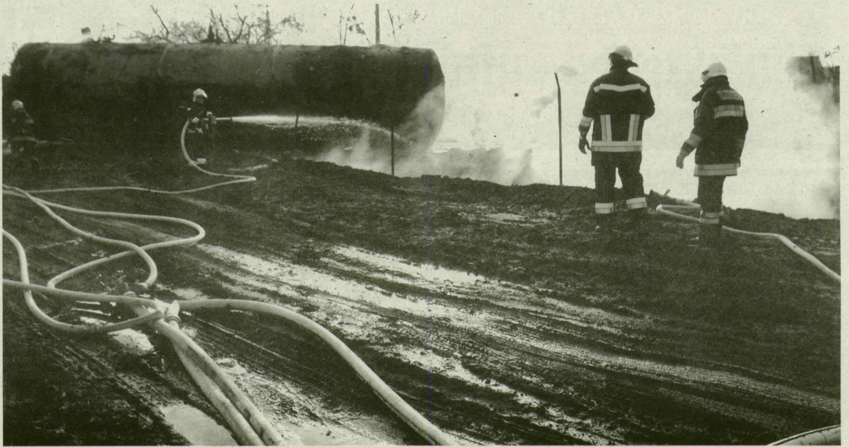
■ GÁZOLAJTÜZET OLTANAK A SZEGEDI RENDEZŐ PÁLYAUDVARON