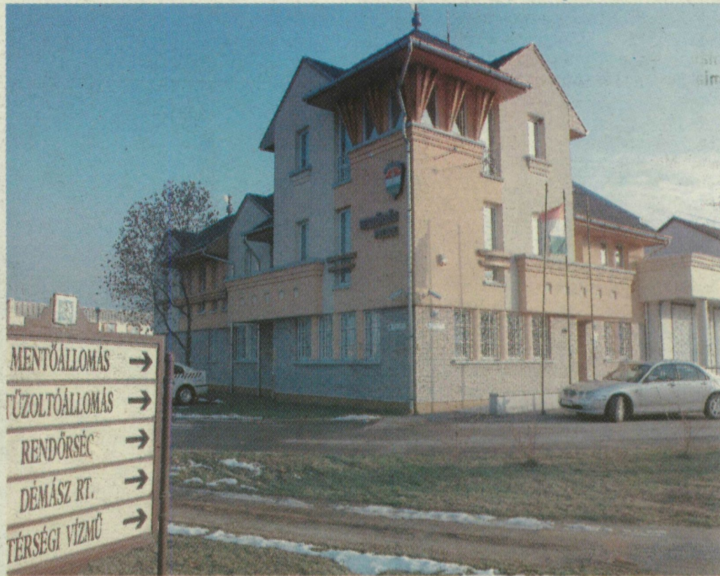
A RENDŐRSÉG RÉGI ÉPÜLETE A POLGÁRMESTERI HIVATAL MELLETT ÉS A MAI, MODERN RIASZTÁSI KÖZPONT AZ ISTVÁN KIRÁLY ÚTON