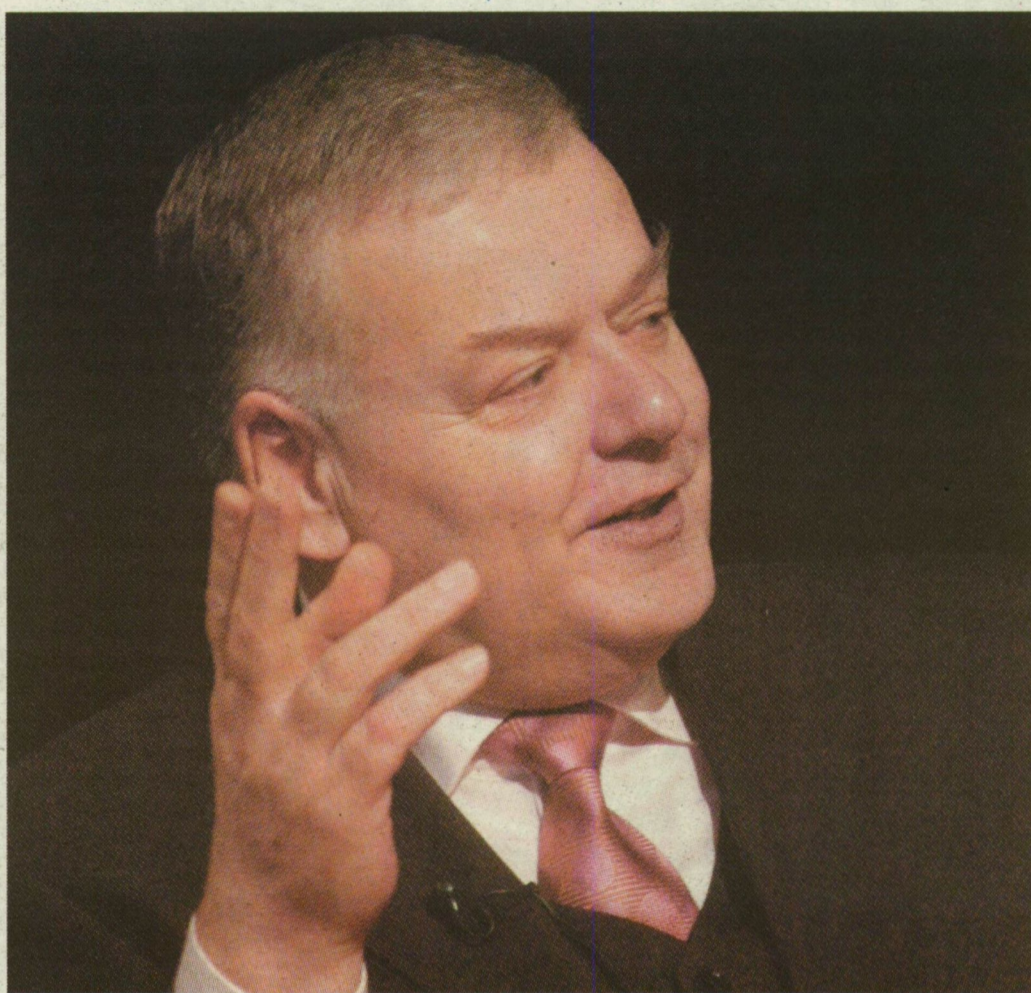
MAKÓ POLGÁRMESTERE ÉS A TÉRSÉG ORSZÁGGYŰLÉSI KÉPVISELŐJE SZERINT IDÉN IS KÉZZELFOGHATÓ LESZ A FEJLŐDÉS

terpelláció és folyamatos egyeztetés eredményeként sikerült a Makón keresztülszállító kamionokat az esti órában lelassítani. Emellett jó néhány egyszerű pillanat is volt az elmúlt esztendőben, ki kell emelni a város történetében először átadott Pulitzer Szülőföldje Díjat is, a rendezvény Makóra fordította az ország figyelmét. A tavaly megszerzett díjak sorában fontos az Arany Rózsa, ami a hazai kertész-