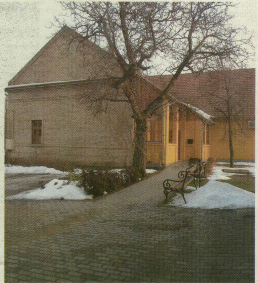
... ÉS MOST

Nem tudni, a kijárás mikor megy ki a divatból, hiszen a mórachalmi hiva-