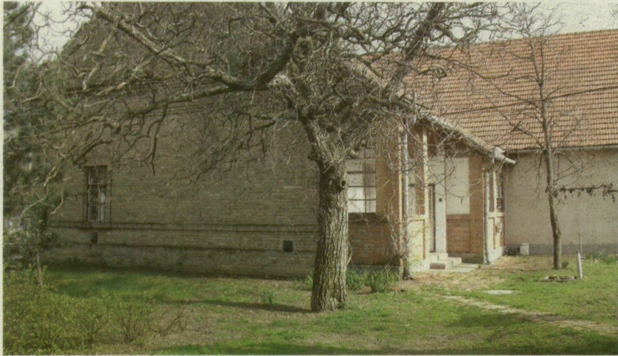
A KISTÉRSÉGI KÖZPONT ÉPÜLETE AZ ÁTALAKÍTÁS ELŐTT...