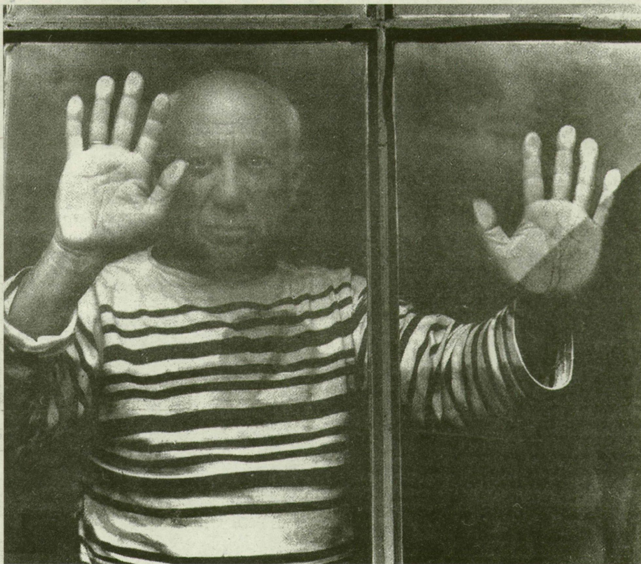
■ AZ ÖSSZETÉVESZTHETETLEN MESTER