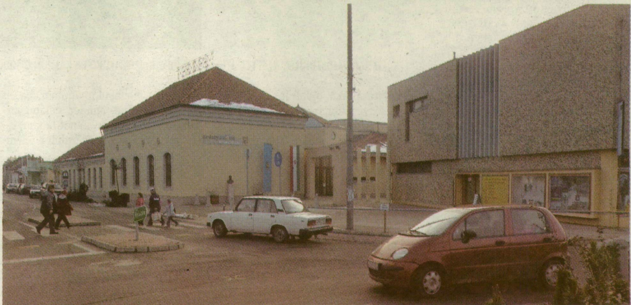
A MEZŐGAZDASÁGI EGYESÜLET SZÉKHÁZA A KÉT HÁBORÚ KÖZÖTT, A MAI ÁRUHÁZ HELYÉN. HÁTTÉRBE A KULTÚRHÁZ, AZ ARANYSZÖM RENDEZVÉNYHÁZ ELŐDJE – RÉGEN ÉS MOST