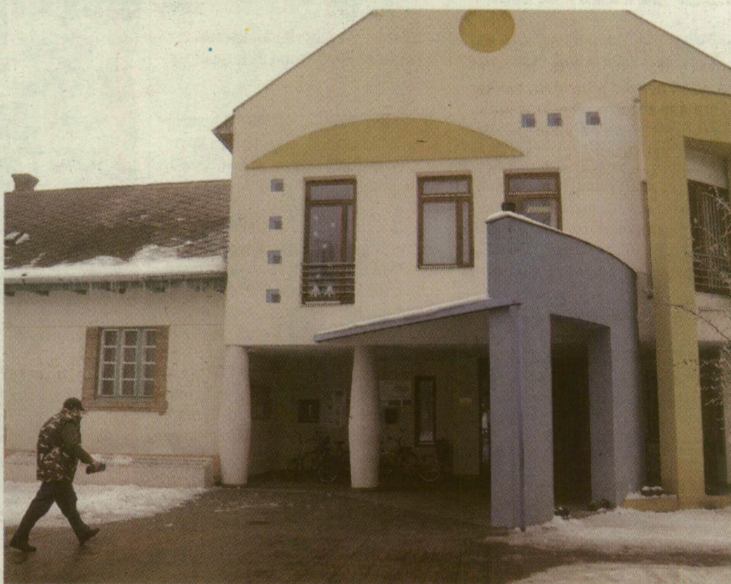
■ A MÓRAHALMI ISKOLA ÉPÜLETE A BŐVÍTÉS ELŐTT ÉS A MOSTANI, 2000-BEN ÁTADOTT ÉPÜLET, AMELYBEN AZ UTÓBBI MÁSFÉL ÉVBEN 800 FELNŐTTET IS OKTATTAK