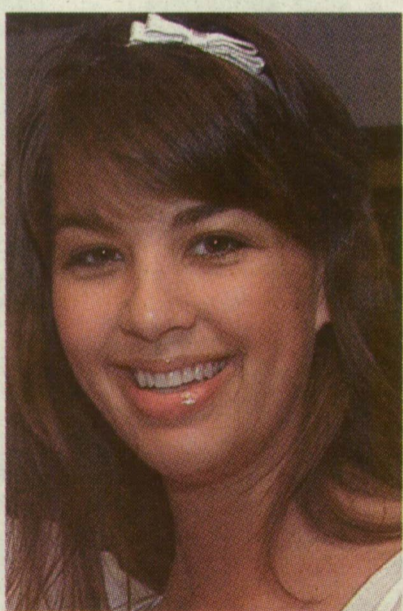
■ ÖRDÖG NÓRA AZ RTL KLUB EGYIK LEGNÉPSZERŰBB MŰSORVEZETŐJE, SZABÓ GÁBOR AKADÉMIKUS LETT

Lapunkban három éve számoltunk be két szegedi fiatal egyedülálló sikeréről: egyetemi felvételt és ötös éretti-