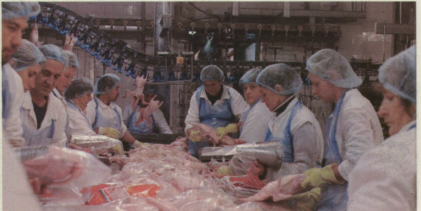
A HUNGERITNÉL MOST NINCS MUNKÁSFELVÉTEL, BEVEZETTÉK A HÚSÉPGÉPZT

A madárinfluenzás időszakal kapcsolatos érdeklődé-