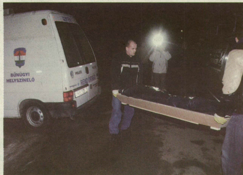
A 46 ÉVES TESTVÉR BELEHALT A KÉSELÉSBE