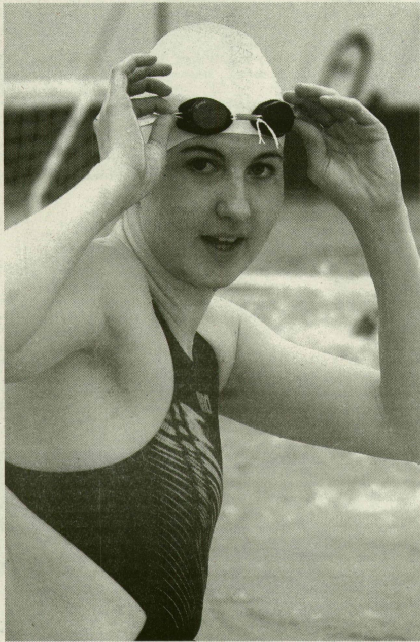
■ A SZEGEDI ÚSZÓNÓ MESSZE KERÜLT A VÁLOGATOTTSÁGTÓL

- Nem hiszem. Sokkal több munkát végeztem el, mint korábban. Mellé