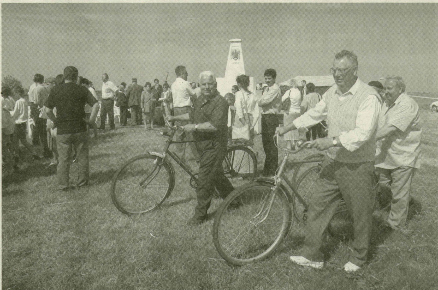
■ HATÁRNYITÁS KÜBEKHÁZÁNÁL, 2004. MÁJUS 22-ÉN. NEM CSAK A SZÉTSZAKÍTOTT CSALÁDOKAT HOZTA ÖSSZE AZ EURORÉGIÓ