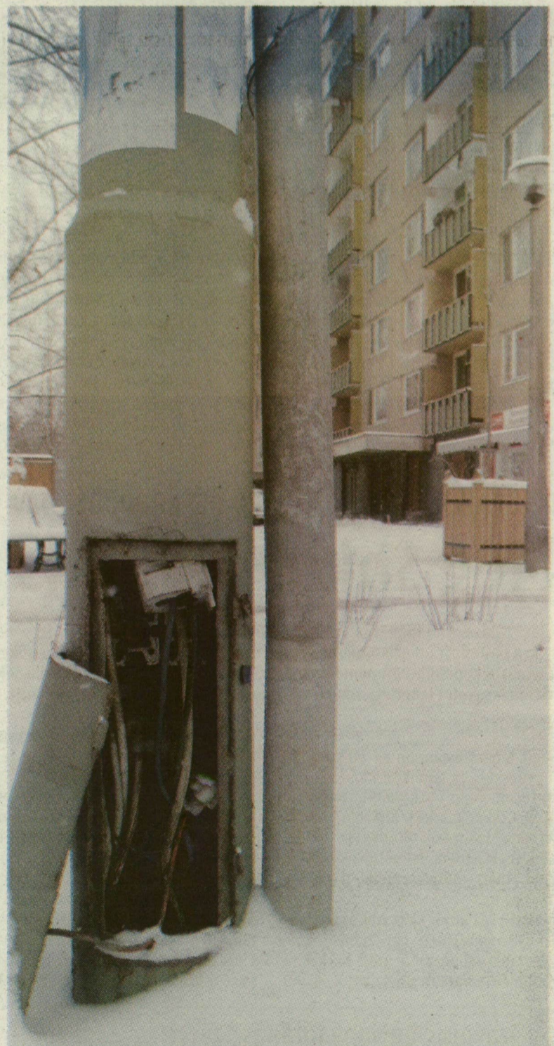
KANDELÁBERCONKÍTÓK. A kandeláberconkítás lassan már rituálé Szegeden, de bárhogy törtük a fejünket, nem tudtuk eldönteni, hogy tolvajok, kétkelkes villanszerelő-gyakornokok vagy részeg erősebbek hobbija a szerelvénydoboz levetkőztetése. Ezt a példányt a Csorba utcában fényképeztük. A legkevesebb, hogy fekete pontot adunk érte.