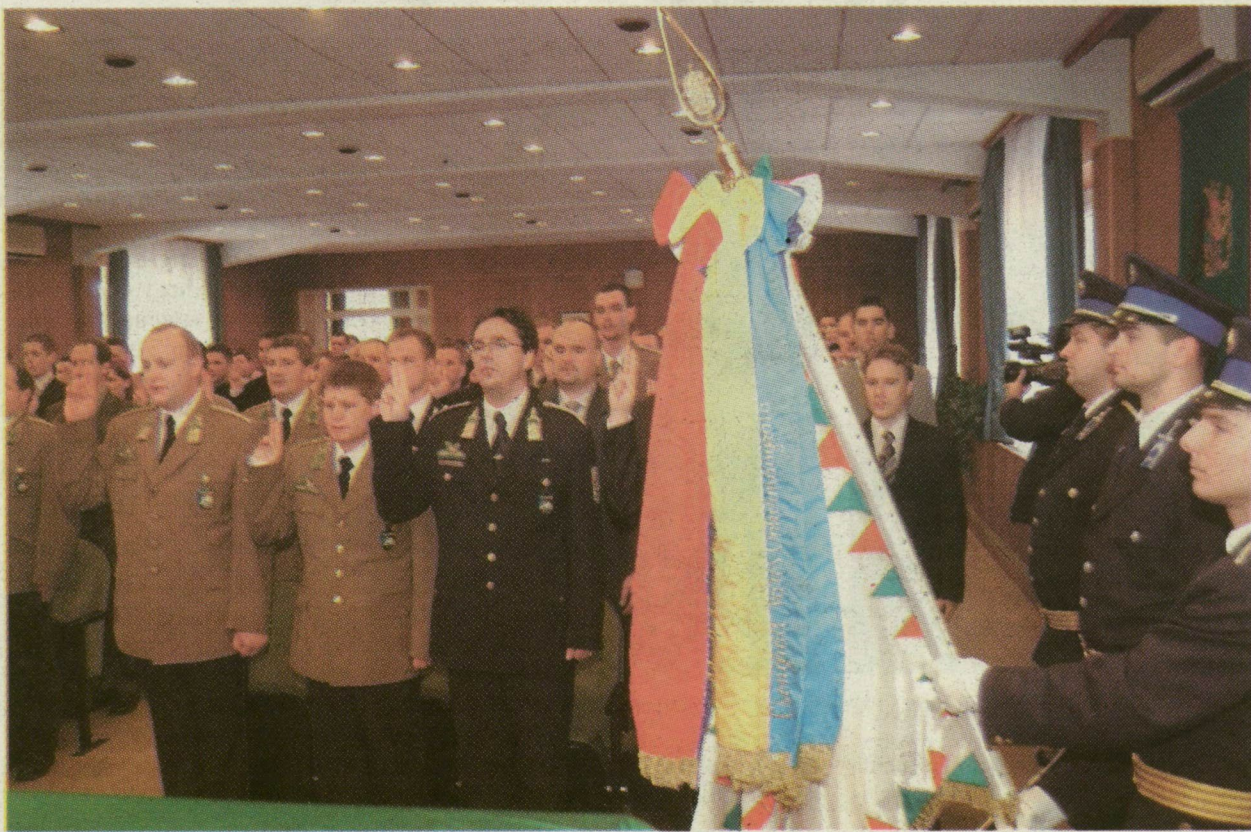
■ SZÁZHÚSZ HATÁRŐR TETT ESKÜT TEGNAP SZEGEDEN, A MEGYEI FŐKAPITÁNYSÁG ÉPÜLETÉBEN