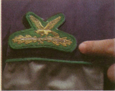
■ EZ A JELZÉS AZ ÚJ EGYENRUHÁN IS MEGMARAD MAJD