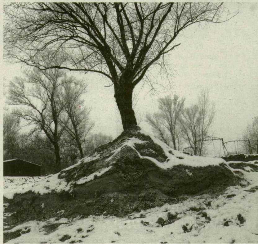
■ HOLDBÉLI TÁJ A FÖLDÖN. A LEGTÖBBI HÓ ELŐTT ÍGY FESTETT A TISZA-PART MINDSZENTENÉL