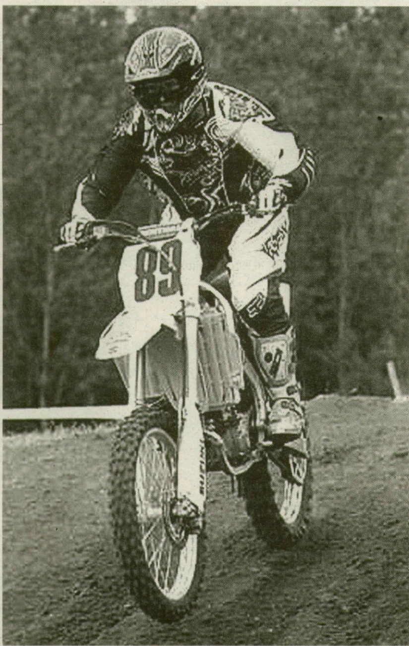
■ AZ EGYKORI ÚSZÓ BAJNOKI FUTAMOKON IS INDUL A CENTER CSAPATÁBAN

” Az úszás? Nem, köszönöm, elég volt! A debreceni rövidpályás Európa-bajnokság közvetítéseit sem néztem. Risztov Éva egykori úszó