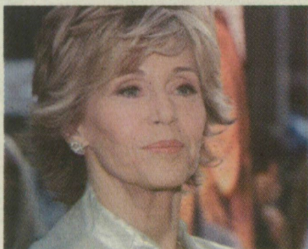
■ 70 ÉVESEN IS VONZÓ