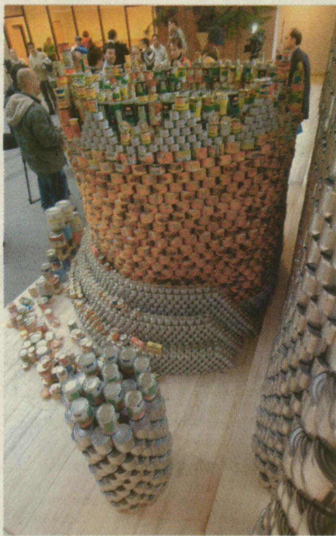
■ AZ ADOMÁNYT A DÉVAI MAGYAR ÁRVÁK KAPJÁK