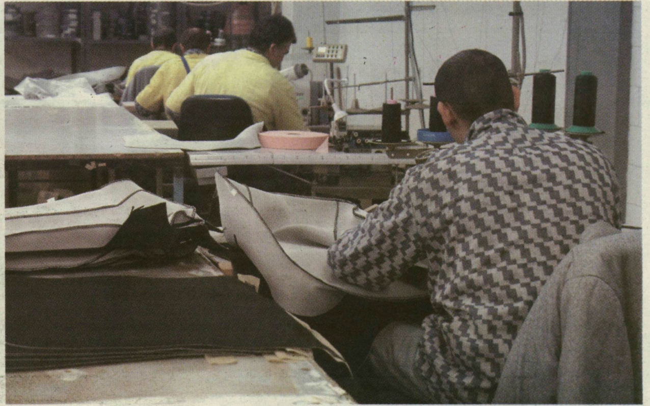
■ AZ ÜZEMEN CIVILRE CSERÉLHETIK A RABRUHÁT A FOGVA TARTOTTAK