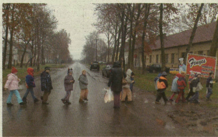
■ ÁTKELÉS. CSANÁDPALOTÁN MINDEN ÉVBEN NŐ A BURKOLT UTAK SZÁMA

Algyő tíz évvel ezelőtt vált el Szegedtől. Ma az 5300 lakosú falu majdnem száz százalékban csatornázott, az utak portmentesek, most épült bölcsőde. Jó néhány civil szervezet működik, köztük olyan is, amely közfeladatot lát el. Önkormányzati cég irányítja a Borbála fürdőt, ahová a helybeliek a vásárhelyihez hasonló kedvezménnyel mehetnek be. A helyhatóság támogatja a helyközi autóbuszberletet, hogy az ittenieknek ne kelljen a teljes árat kifizetniük. Ezentúl azonban minden fillért élére állítanak Algyőn is, és nem terveznek olyan juttatásokat, mint a szintén nagy iparüzési adó-bevétellel rendelkező Berentén