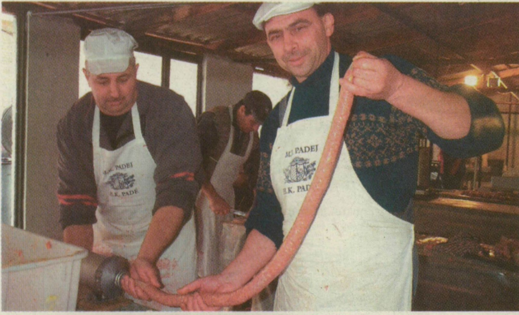
■ TEKEREDIK A PALOTAI KOLBÁSZKÍGYÓ. A PADÉIAK A SAJÁT FÜSZEREIKET HOZTÁK