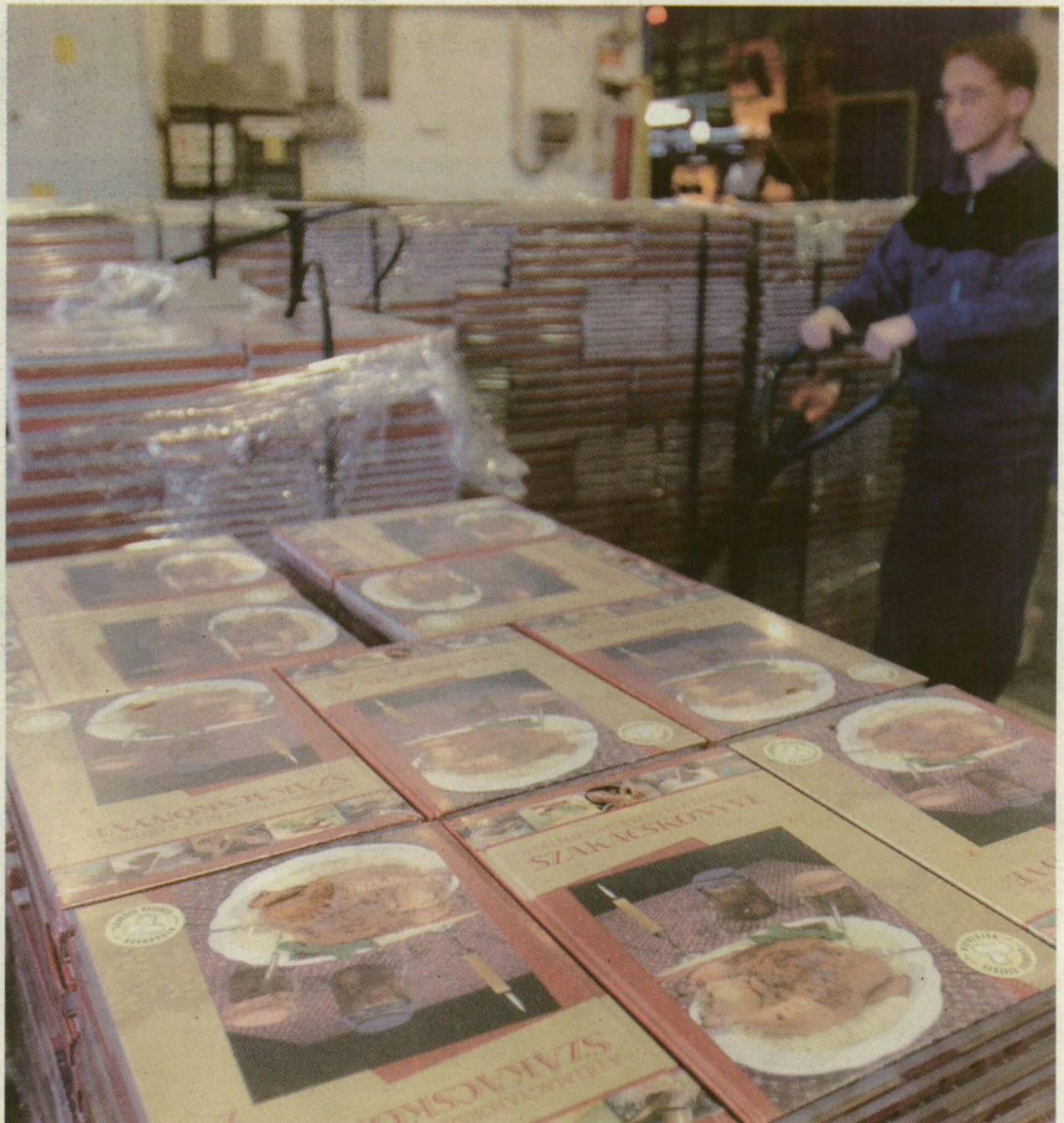
OLVASÓINK RECEPTGYŰJTEMÉNYE SZÉP KARÁCSONYI AJÁNDÉK LESZ